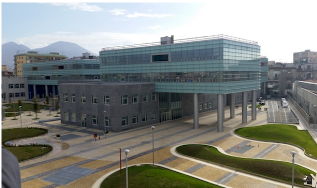
Il Complesso Universitario di San Giovanni

Per gli studenti la cui immatricolazione sia stata effettuata dopo che si è raggiunta la numerosità limite, non sarà possibile assicurare il soddisfacimento automatico della preferenza espressa sulla sede di frequenza dei corsi di I anno. In questi casi l' assegnazione della sede sarà effettuata d'ufficio sulla base di criteri di razionalizzazione dell'organizzazione didattica complessiva . In ogni caso allo studente che si trova in questa condizione è garantita la possibilità di frequenza al Corso di Laurea prescelto in uno dei due Poli.