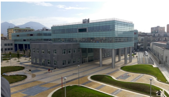
Il Complesso Universitario di San Giovanni

Per gli studenti la cui immatricolazione sia stata effettuata dopo che si è raggiunta la numerosità limite, non sarà possibile assicurare il soddisfacimento automatico della preferenza espressa sulla sede di frequenza dei corsi di I anno. In questi casi l'assegnazione della sede sarà effettuata d'ufficio sulla base di criteri di razionalizzazione dell'organizzazione didattica complessiva . In ogni caso allo studente che si trova in questa condizione è garantita la possibilità di frequenza al Corso di Laurea prescelto in uno dei due Poli.